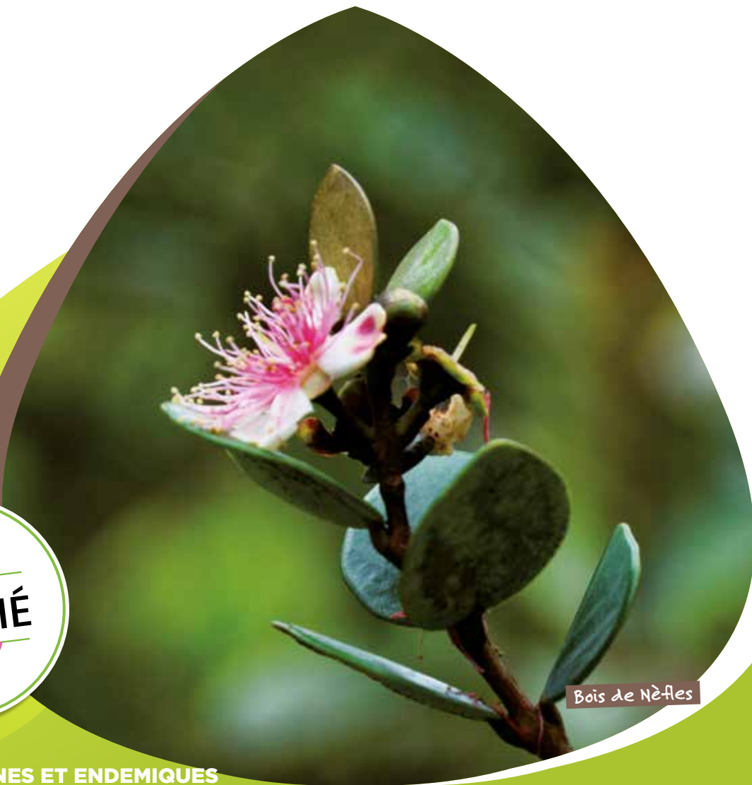
Bois de Nèfles