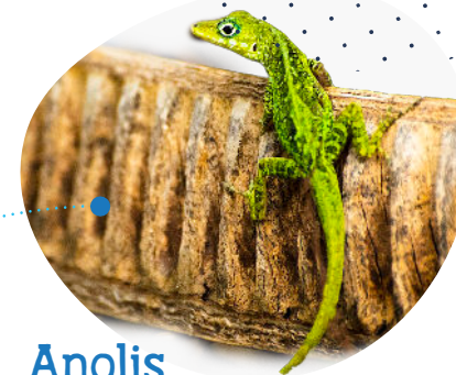
Anolis Dactyloa roquet