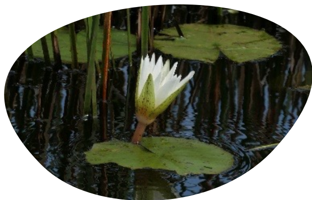
Nénuphar Nymphaea ampla

COMMUNAUTÉ D'AGGLOMÉRATION DE L'ESPACE SUD MARITIMQUE