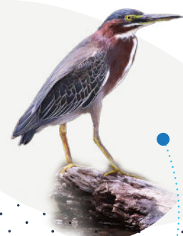
Kayali Butorides virescens

COMMUNAUTÉ D'AGGLOMÉRATION DE L'ESPACE SUD MARITIME