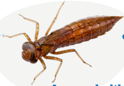
Larve de libellule