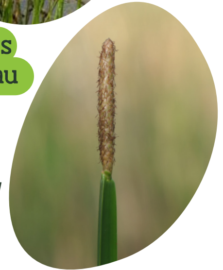
Joncs Eleocharis mutata