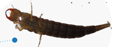
Larve de dytique