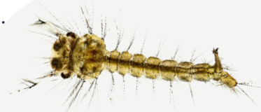
Larve de moustique