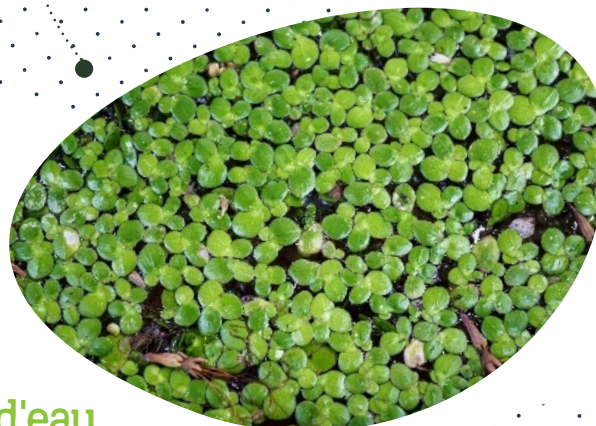
Lentille d'eau Lemna sp.