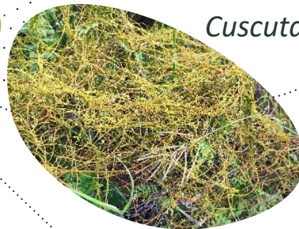
Vermicelle Cuscuta americana