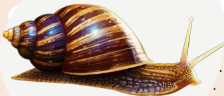
Escargot géant africain Lissachatina fulica