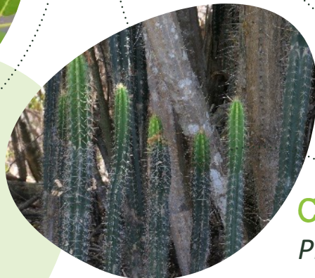
Cactus cierge Pilosocereus curtisii