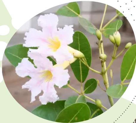
Poirier péyi Tabebuia heterophylla