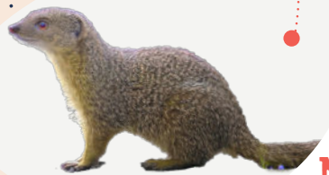
Mangouste Urva auropunctata