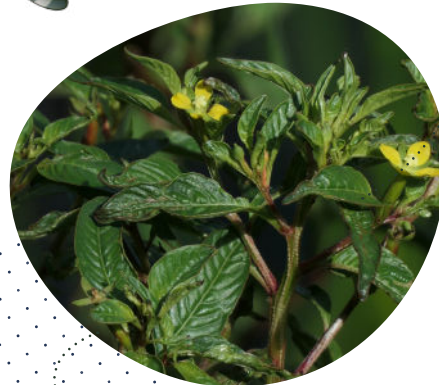
Giroflé à mare Ludwigia octovalvis