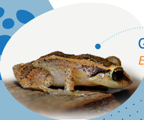
Grenouille Eleutherodactylus martinicensis