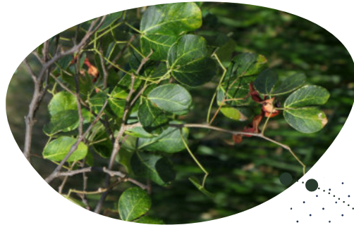
Griffe-chat Pithecellobium unguis-cati