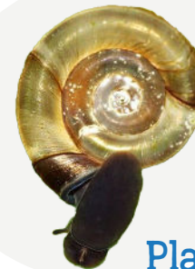
Planorbe Commune Planorbis planorbis