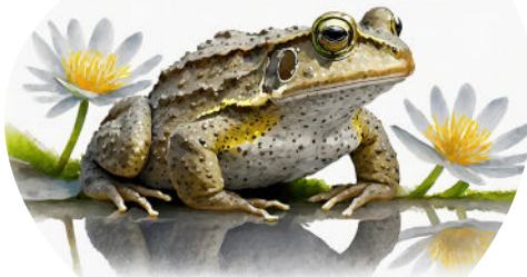
Crapaud buffle Rhinella marina