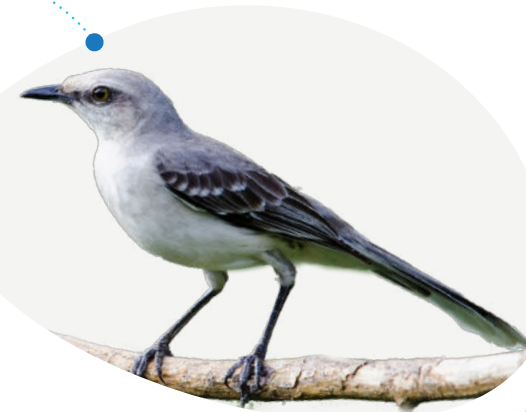
Moqueur des savanes Mimus gilvus