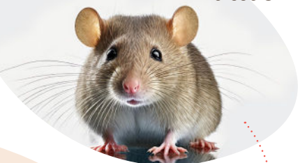
Rat Rattus norvegicus