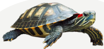
Tortue de Floride Trachemys scripta elegans