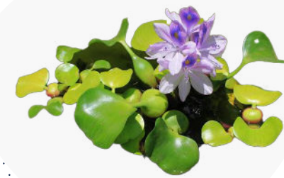
Jacinthe d'eau Eichhornia crassipes