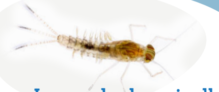
Larve de demoiselle