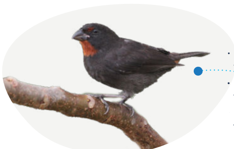
Rouge-Gorge Loxigilla noctis