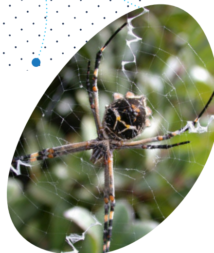
Araignée argentée Argiope argentata